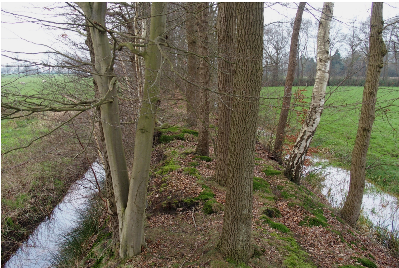
De landweer bij het Jachthuis.

omgeven door een sterke landweer, waarvan ook de landweren op Weleveld onderdeel uitmaakten. De doorgangen in de landweren konden met (draai) bomen worden afgesloten, zie ook de reconstructie op Weleveld. Omdat de doorgangen nauw waren,